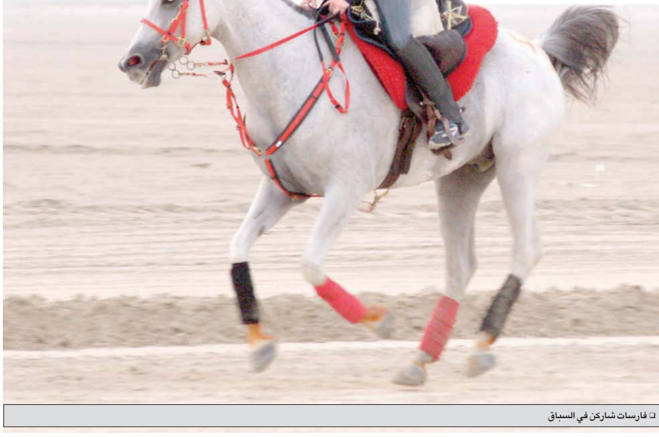
□ فارسات شاركن في السباق

كانت سيطرة فريق الشقبة للتحمل واضحة على نتائج السباق منذ بدايته حيث حقق فرسان الشقبة القمة في مختلف المسافات وذلك بعد مشاركة فريقين للمربط، وهو ما كان متوقعا بعد المستوى الذي ظهر عليه فرسان وجياد الشقبة في المنافسات الأخيرة،